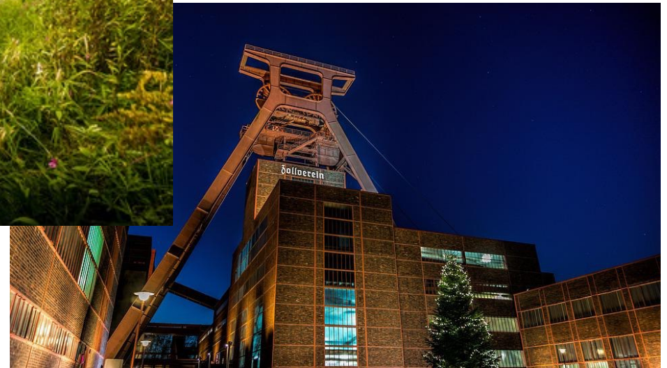
Zeche Zollverein