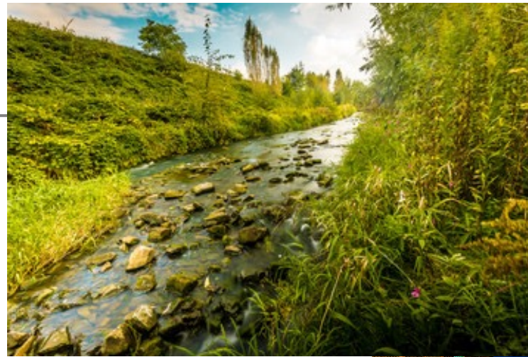
Neue Emscher Landschaft

Designing Equitable and Engaging Pathways to Sustainability